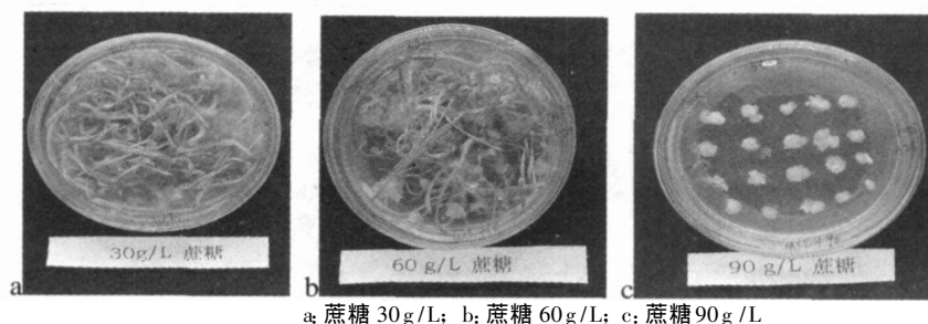
图3 培养基中附加不同浓度蔗糖愈伤组织分化情况

分析结果表明,蔗糖 30g/L 对根苗的分化最有利,90g/L 的分化效果最差。可能是蔗糖浓度太高造成细胞内的渗透压增大,引起质壁分离无法复原,从而影响愈伤分化。